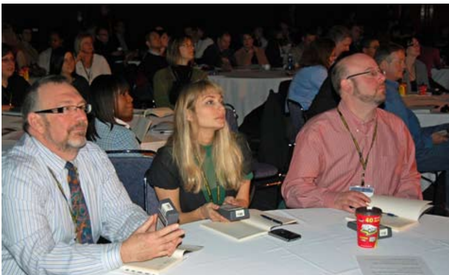
Les délégués participent au sondage électronique