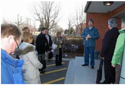
Visite des délégués au Collège militaire royal de Saint-Jean

et leurs compétences diverses pour organiser un événement dont on gardera le souvenir pendant un bon moment.