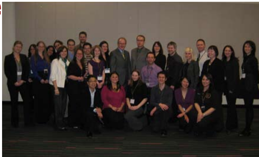
Les membres du RJFF avec le greffier